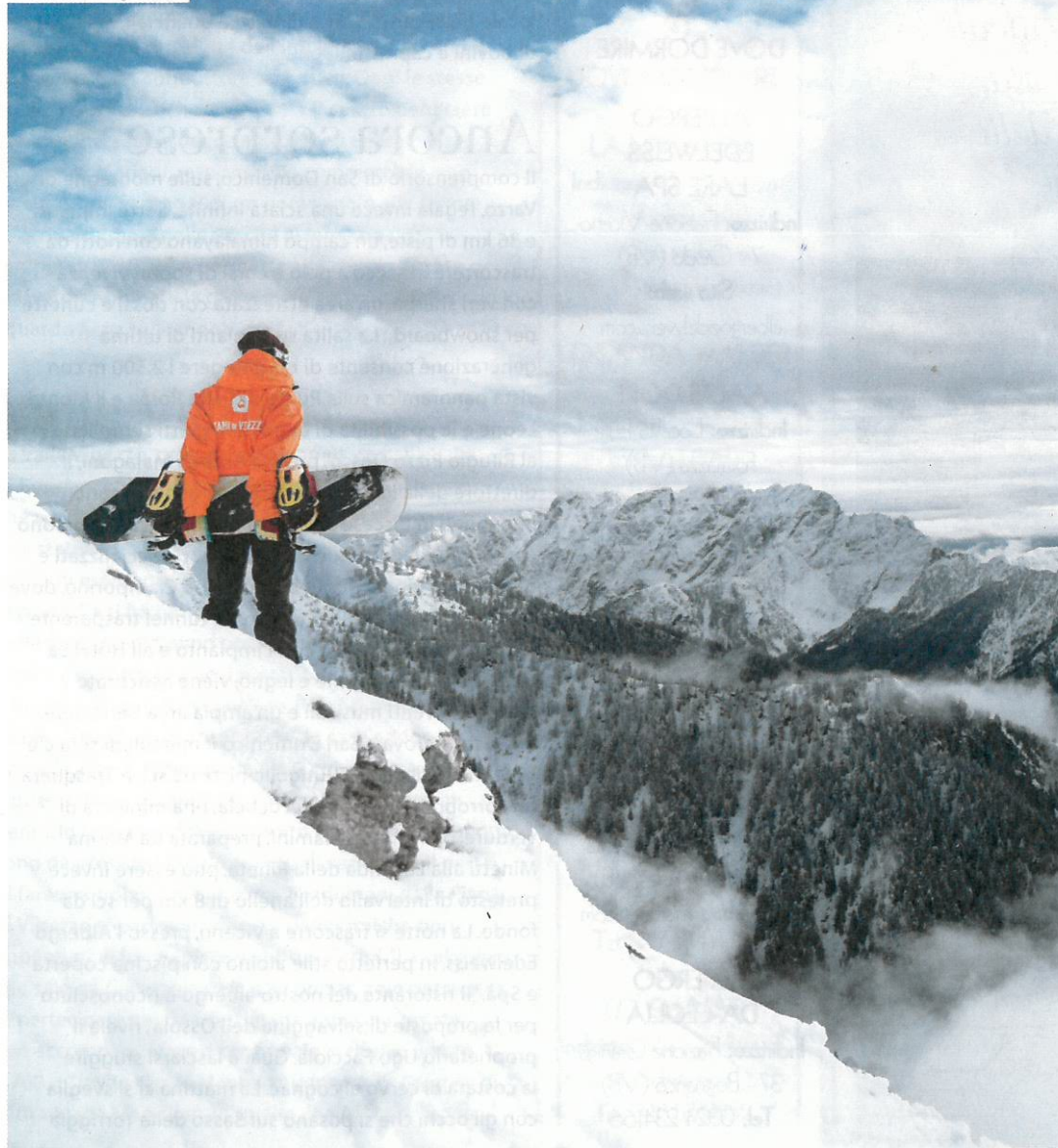
Piana di Vigizzo