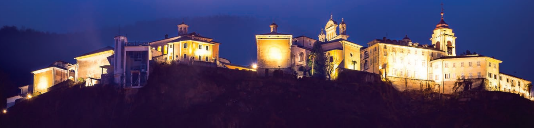
Varallo, Sacro Monte.