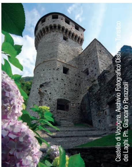
Castello di Vogogna.