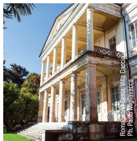
Romagnano Sesia, Villa Caccia.