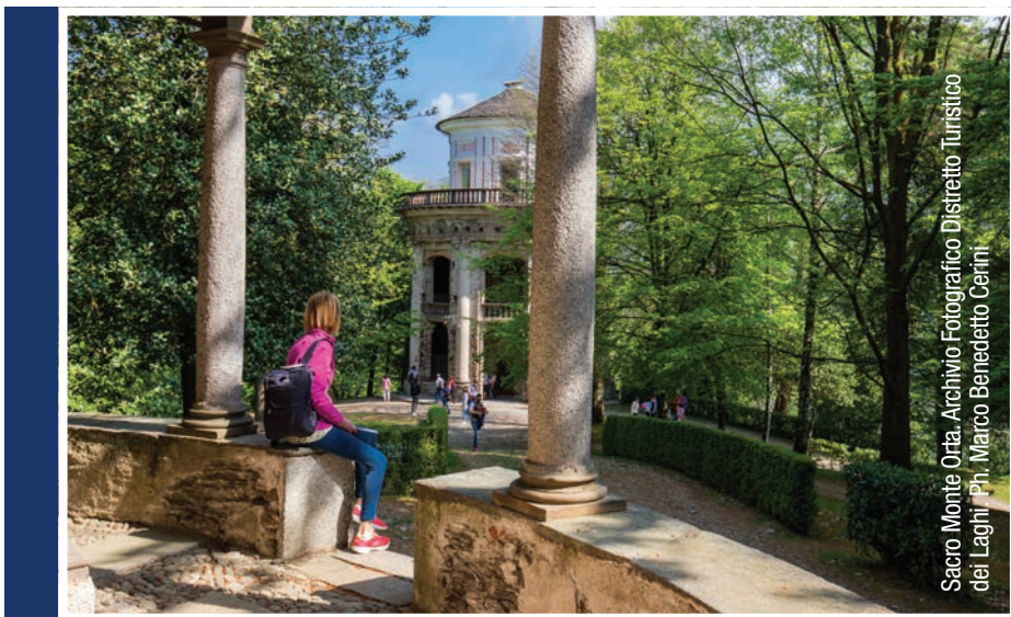
Sacro Monte Orta.