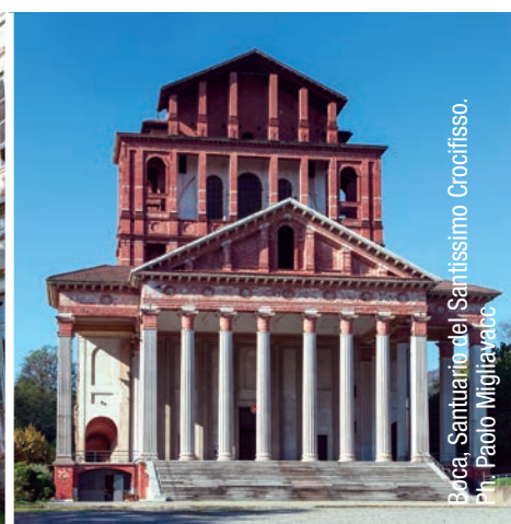
Boca, Santuario del Santissimo Crocifisso.