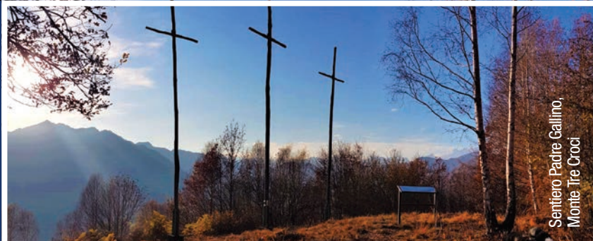
Sentiero Padre Gallino, Monte Tre Croci