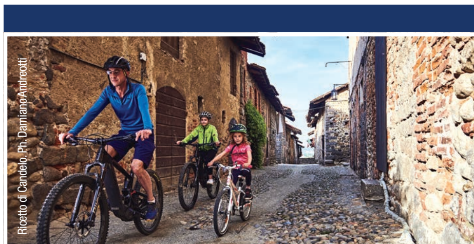
Ricetto di Candelo.

L'arte del talentuoso Gaudenzio Ferrari impreziosisce anche Vercelli . La sua creatività si esprime in maniera superlativa negli affreschi della Chiesa di San Cristoforo , nota non a caso come la Cappella Sistina di Vercelli : vedere per credere. Un altro primato cittadino è legato alla tradizione agricola: Vercelli è infatti nota come capitale europea del riso nonché punto di partenza delle tante strade di campagna che, tagliando le risaie allagate, la pongono al centro di un singolare 'mare a quadretti' . Fra le altre attrattive in città, ci sono il Duomo - che vanta il primato di diocesi più antica del Piemonte -, l' Abbazia di Sant'Andrea - simbolo cittadino e uno dei primi esempi in Italia di fusione tra stile gotico e romanico - il Museo Borgogna , il MAC-Museo Archeologico e il Museo Leone , dove fra i moltissimi reperti si conserva una rara epigrafe bilingue in latino e leponzio , antichissimo alfabeto affine all'etrusco.