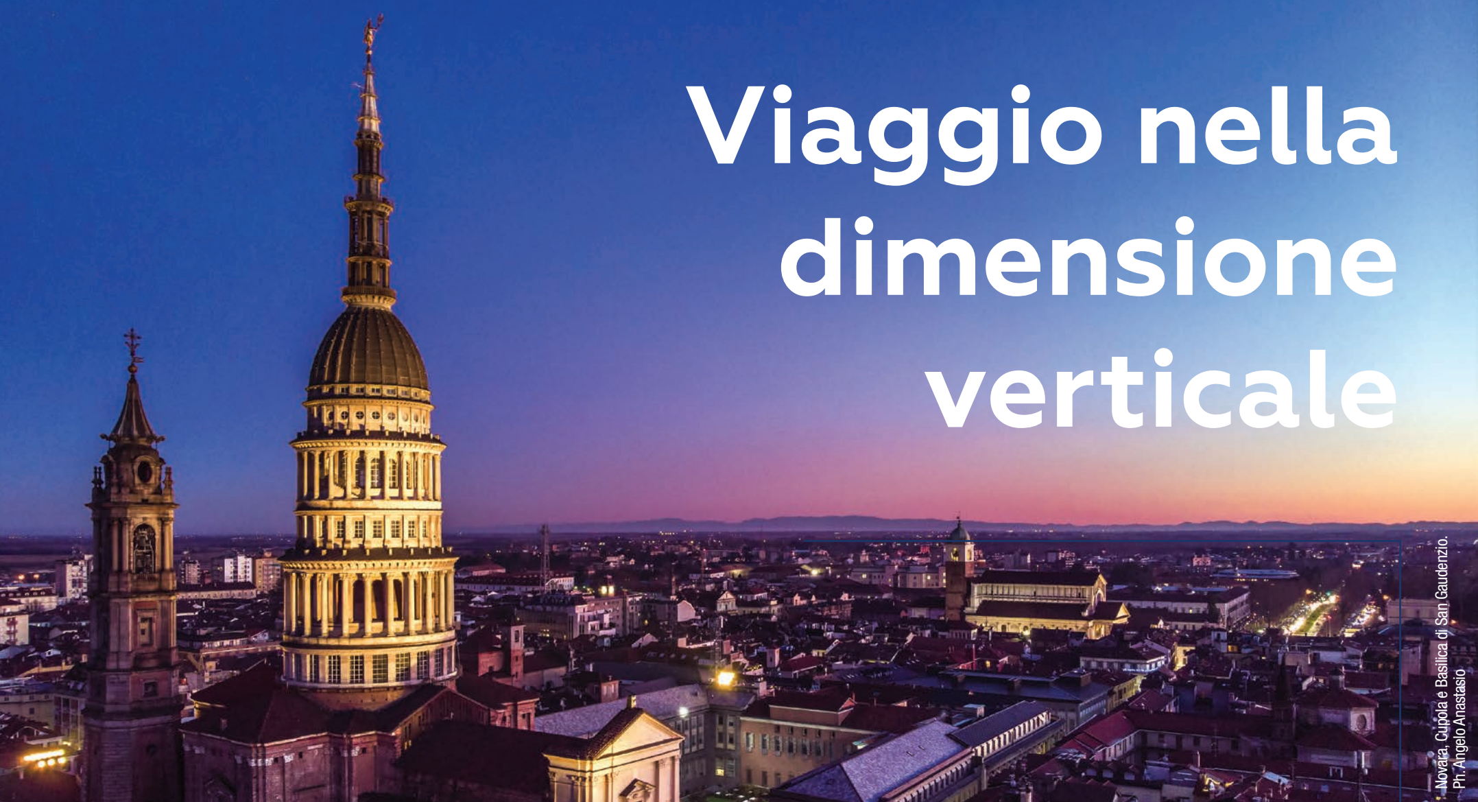
Novara, Cupola e Basilica di San Gaudenzio.

Una vacanza culturale nel Novarese realmente fuori dagli schemi, attraverso i camminamenti della Cupola di San Gaudenzio appena aperti al pubblico. Il piacere di andare alla scoperta di spazi rimasti segreti per lungo tempo.