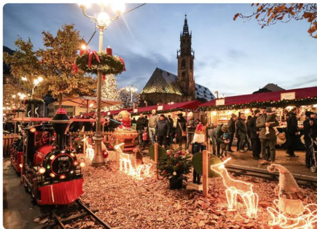
Mercatini di Natale a Bolzano