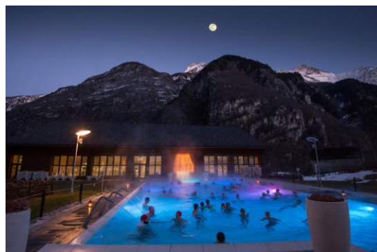
Terme di Premia (VB)