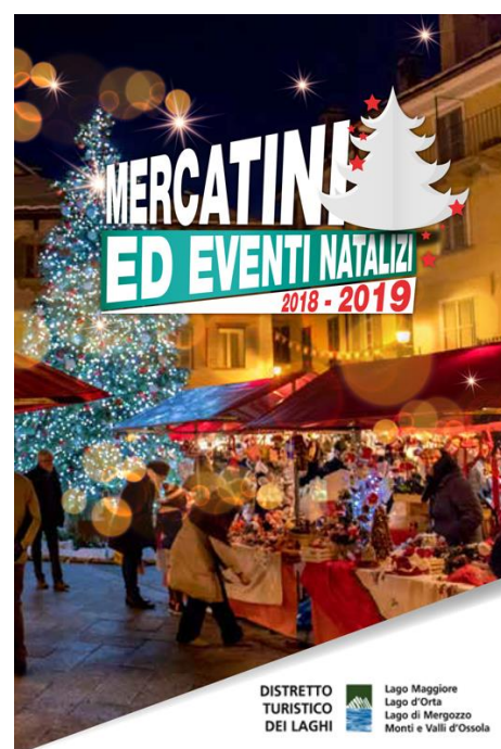
Libretto “Mercatini ed Eventi Natalizi 2018-2019”