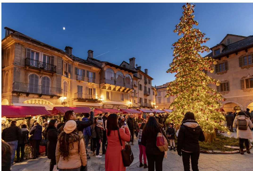
Mercatini di Natale di Domodossola (VB)