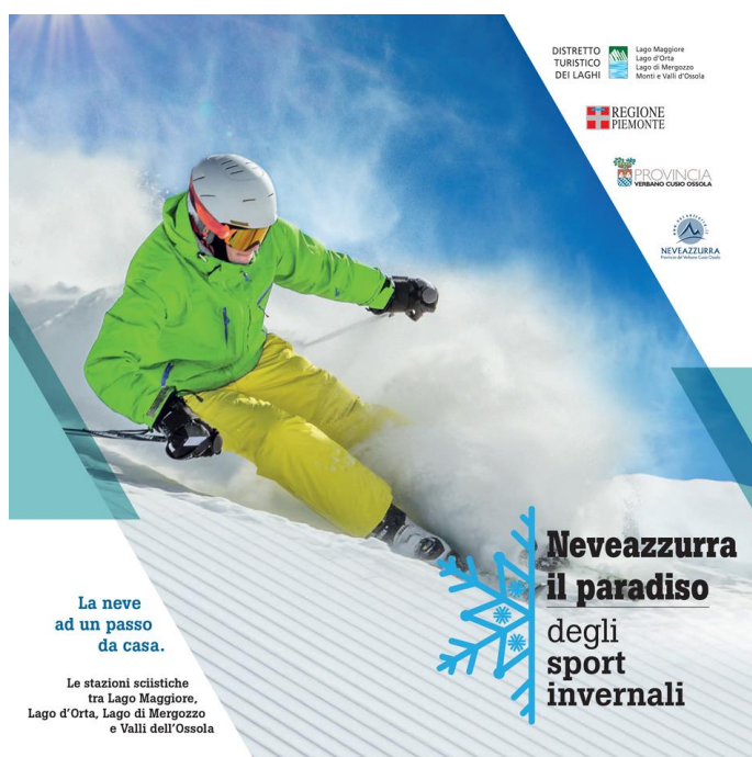
Brochure “Neveazzurra, il Paradiso degli sport invernali”