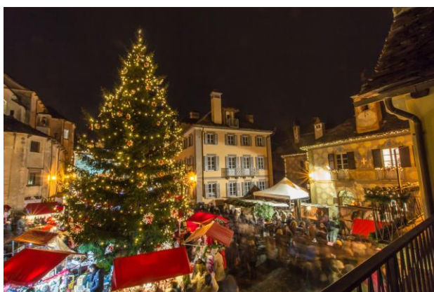
Mercatini di Natale di Santa Maria Maggiore (VB)

"Siamo estremamente soddisfatti di questo risultato – commenta il Presidente del Distretto Turistico dei Laghi Oreste Pastore. Sul nostro territorio - su cui è importante segnalare che influisce significativamente anche un altissimo numero di seconde case - i turisti crescono anche grazie alle numerose iniziative e manifestazioni che sono ormai caratterizzanti anche del periodo natalizio: oltre 30 mercatini di Natale - di cui almeno 10 di prestigio - per un totale di circa 80 eventi di cui andiamo molto orgogliosi, anche per gli altissimi numeri e presenze raggiunte quest'anno che hanno coinciso proprio con le date di questi appuntamenti".