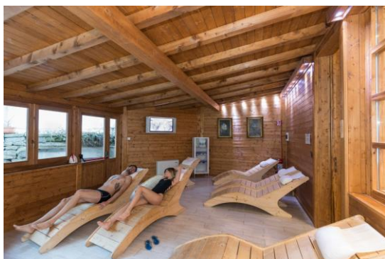
Terme di Bognanico (VB)

Da segnalare infine il settore wellness , richiestissimo anche nel periodo natalizio, grazie a strutture termali (Terme di Premia, Terme di Bognanico) e ricettive (anche di nuova edificazione) di pregio (tra loro convenzionate a favore della clientela) e che segnala un aumento dei flussi - rispetto allo scorso anno - nel periodo compreso tra il 26 dicembre 2018 e il 6 gennaio 2019.