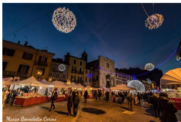
Marco Benedetto Cerini Mercatini di Natale di Arona (NO) Foto di @Marco Benedetto Cerini