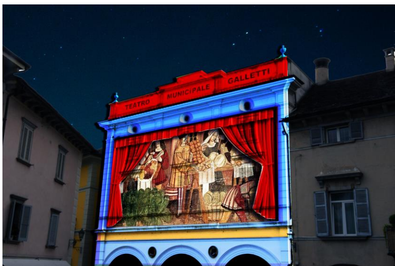
Rendering dimostrativo - Teatro Galletti – Domodossola