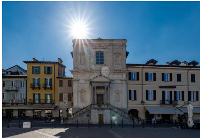
Chiesa Santa Maria di Loreto - Arona