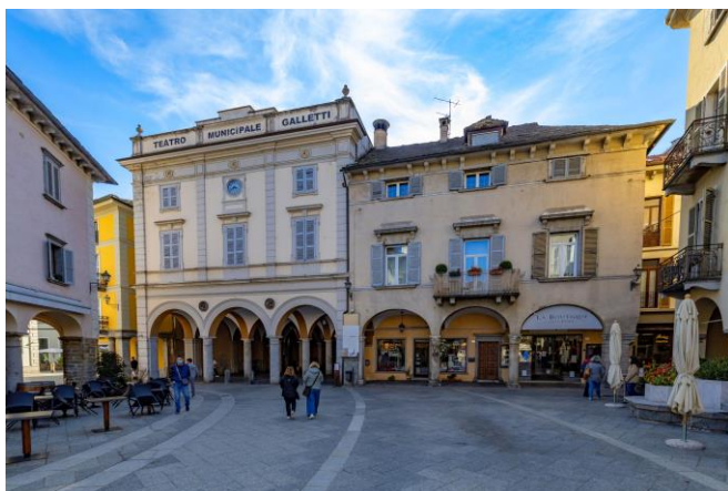
Teatro Galletti – Domodossola

I borghi scelti per questi spettacoli-pilota sono due località e piazze ideali - per conformità, spazi, bellezza, notorietà e accessibilità - e perfettamente adattabili a spettacoli di questo tipo: DOMOSSOLA (VB - Ossola) - "Borgo della Cultura" - con la sua PIAZZA MERCATO e ARONA (NO - Lago Maggiore) - borgo Bandiera Arancione del Touring Club Italiano - e la sua PIAZZA DEL POPOLO , entrambe cuori delle cittadine.