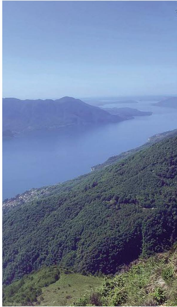
Il Lago Maggiore visto dai sentieri del monte Morissolo, perché un'escursione è tra i piaceri migliori che offra qualunque lago. A sinistra il residence casa e vela