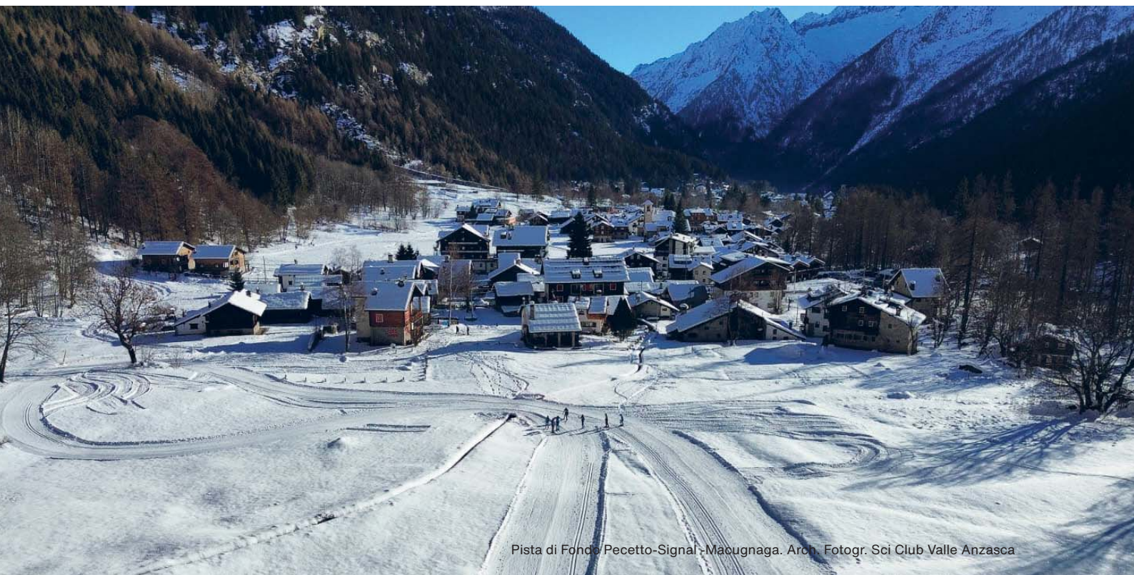
Pista di Fondo Pecetto-Signal-Macugnaga.

I Walser erano una comunità cattolica, molto coesa e organizzata, dedita alla coltivazione di segale, orzo e patate, e all'allevamento dei bovini.