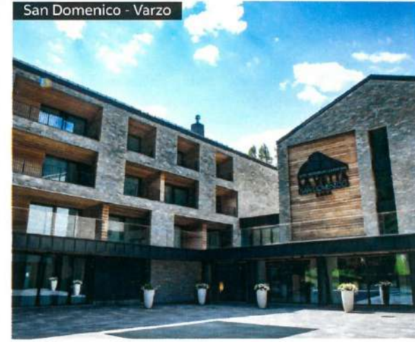
San Domenico - Varzo