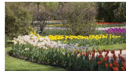
Verbania, Lago Maggiore

Con le loro ville storiche e i grandi giardini botanici , i laghi del nord Italia sono tra le mete più affascinanti da visitare in primavera. In Piemonte, tra il Lago Maggiore e il Lago d'Orta , la natura offre un vero spettacolo di colori. Tra gli eventi più attesi per accogliere la primavera c'è la Festa degli Agrumi di Cannero Riviera . Il paese apre i suoi giardini pieni di limoni e aranci . I profumi avvolgono e i colori ancora timidi incantano. Da fine marzo, a Verbania , la primavera esplose e si svolge ogni anno la Mostra delle Camelie all'interno di Villa Giulia : centinaia di camelie colorano di rosa i giardini della villa. Uno spettacolo imperdibile.