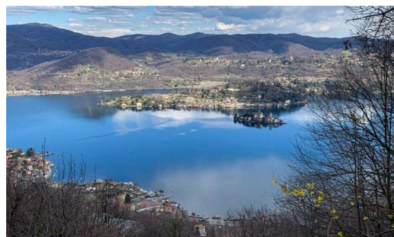
Il Lago d'Orta visto da Boletto (foto Distretto Turistico dei Laghi/Franco Gemelli)

Due itinerari in particolare rappresentano un ottimo punto di partenza per scoprire il territorio su due ruote: un giro cicloturistico su strada attorno al lago e un anello per mountain bike che percorre i versanti collinari circostanti (in apertura, una vista panoramica dal Santuario della Madonna del Sasso. Foto dell'Archivio del Distretto Turistico dei Laghi/Pier Maulini).