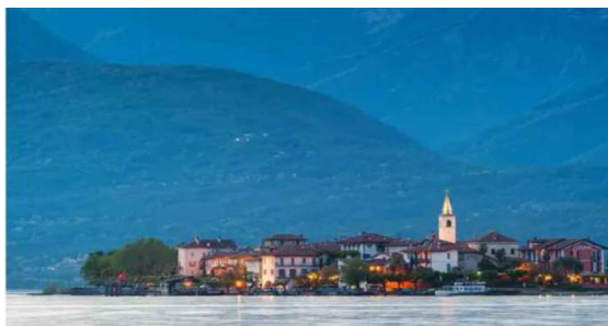
L'isola dei Pescatori sul Lago Maggiore

Torna la stagione nelle Terre Borromeo: tutte le esperienze da vivere sul Lago Maggiore