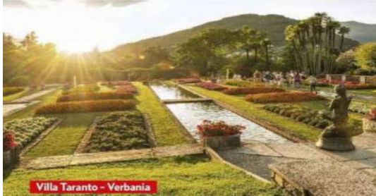
Villa Taranto - Verbania