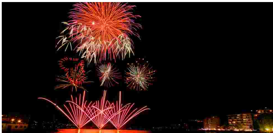
"Fiori di Fuoco 2014" comes to the end with the Grand Gala on August 24 in Omegna

S.Maria Maggiore >>> // */ "Sentieri e Pensieri" cultural event* >>> 20-24/08 >>> +39 0324 95091