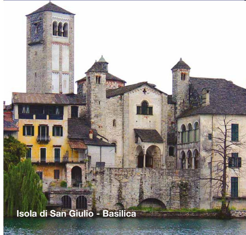
Isola di San Giulio - Basilica