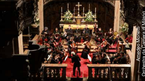
Amedeo Monetti Orchestra da Camera di Milano