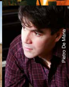
Pietro De Maria