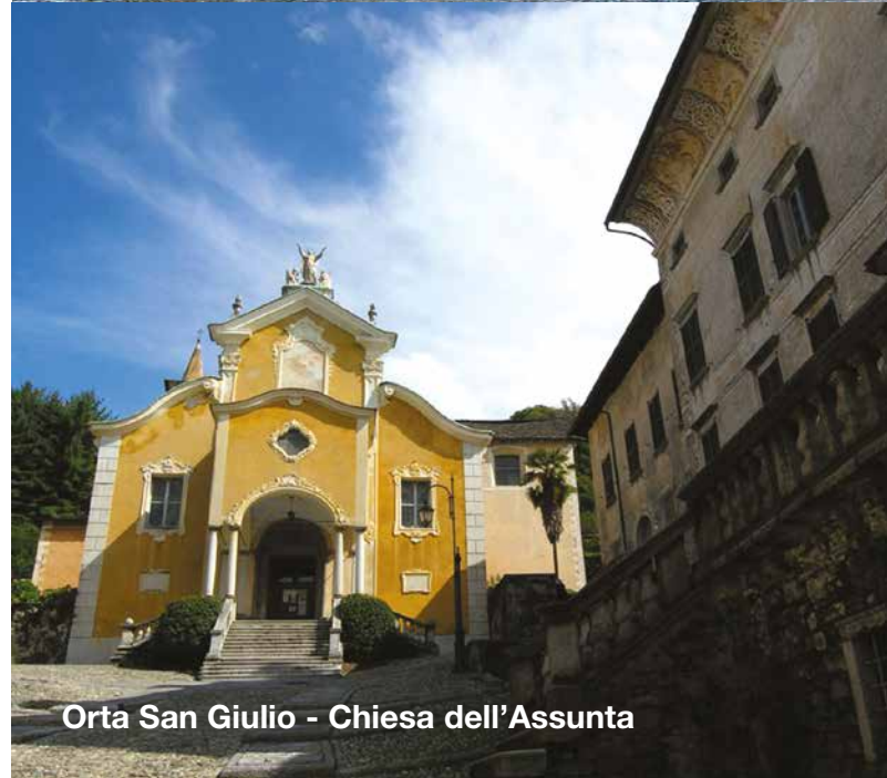
Orta San Giulio - Chiesa dell'Assunta