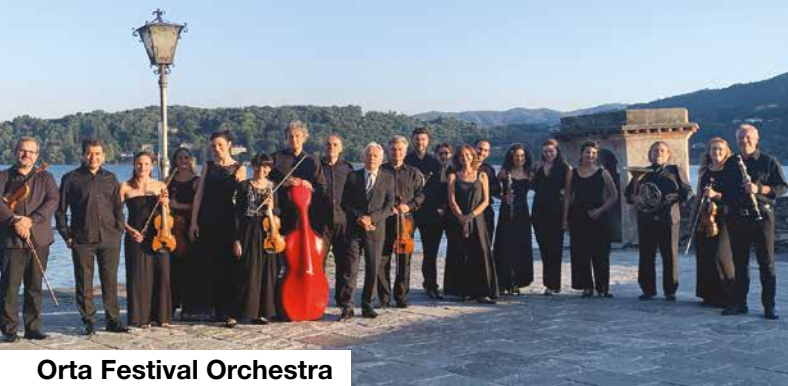
Orta Festival Orchestra