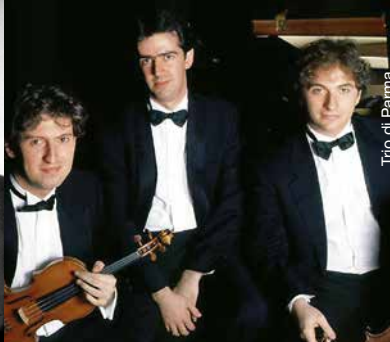
Trio di Parma